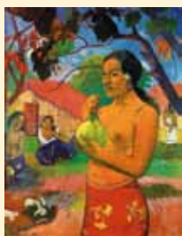
Kobieta trzymająca owoc, 1893r.