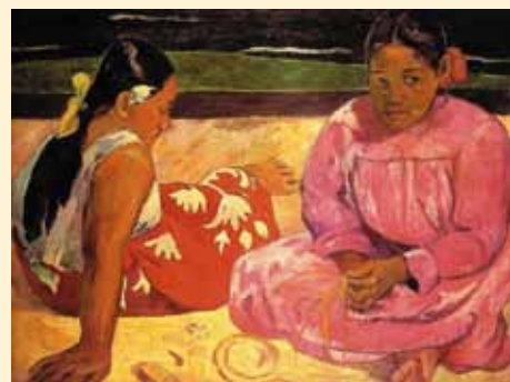
Tahitijskie kobiety na plaży, 1891r.

Gauguin umiera 8 maja 1903 roku, w chwili kiedy galeria Vollard organizuje wystawę jego pięćdziesięciu obrazów i dwudziestu siedmiu rysunków, a Salon Jesienny poświęca mu całą salę.