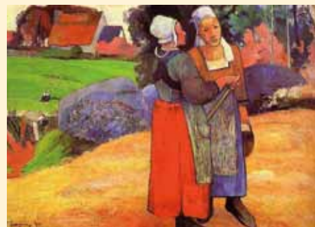
Kobiety bretońskie, 1894r.