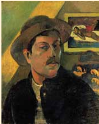
Paul Gauguin - Autoportret

Paul Gauguin urodził się 7.06.1848 roku w Paryżu. Był synem dość znanego dziennikarza oraz pisarki i socjalistki w jednej osobie. Gauguin urodził się w czasach gdy trwały właśnie "Wiosny Ludów". Ojciec postanowił zabrać całą swoją rodzinę i wyjechać do Peru - do dalekiej rodziny żony. Niestety ojciec zmarł podczas podróży.